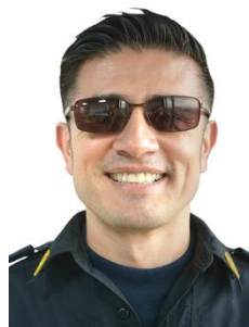
Anteojos de sol