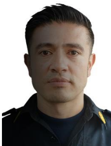
Sombra sobre el rostro