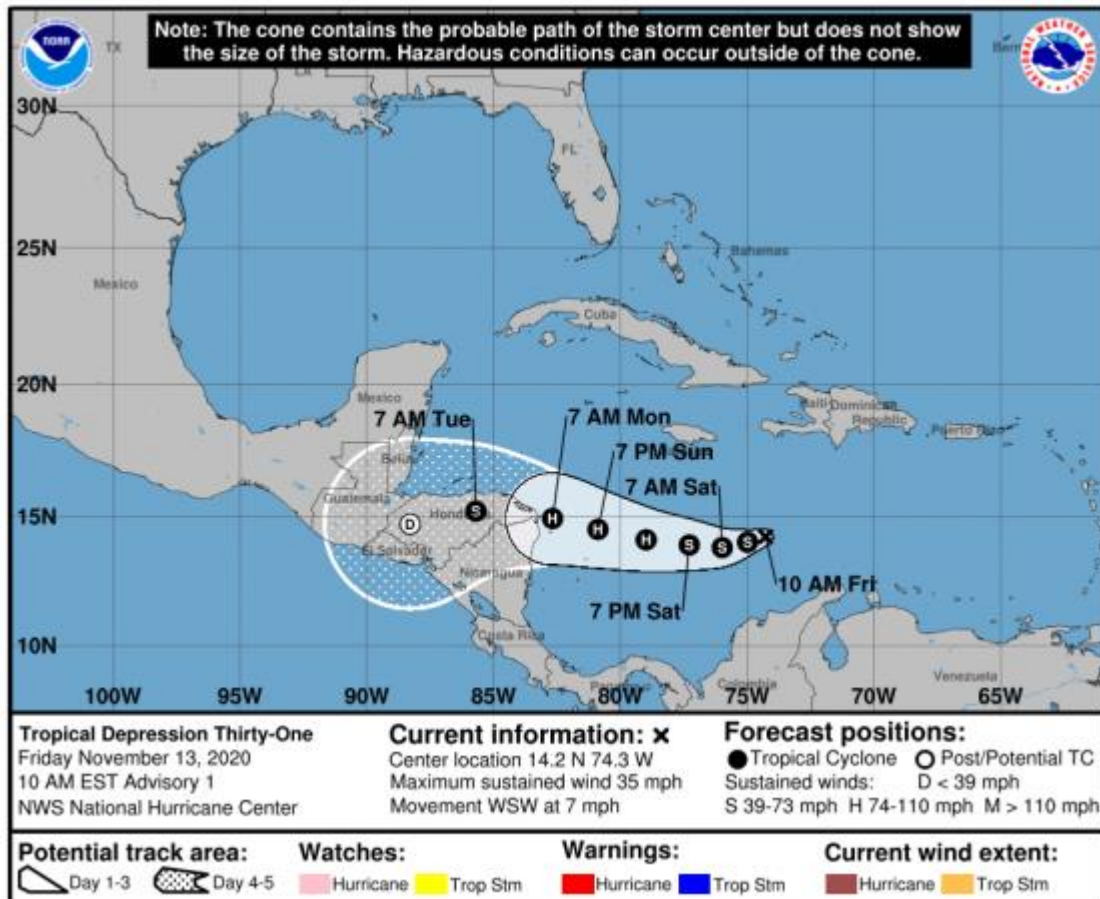
Gráfica 1. Cono de la posible trayectoria de la depresión tropical #31 para los siguientes días. NHC-National Hurricane Center 13 de noviembre de 2020. Hora 10:00 HLC.

Especial atención ameritan zonas de ladera localizadas en las inmediaciones de la Sierra Nevada de Santa Marta, ubicadas en el Sur de La Guajira y Norte de Cesar y Magdalena. Igualmente, sectores de los departamentos de Norte de Santander, Santander, Bolívar; Atlántico, Córdoba, Sucre, Antioquia, Boyacá, Cundinamarca, Chocó, Risaralda, Caldas, Quindío, Valle del Cauca, Occidente de Arauca, Casanare y Meta, ante la probabilidad de crecientes súbitas o deslizamientos de tierra.